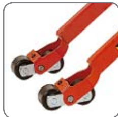
Die Tandem-Gabelrollen haben eine Bremsicherung und schonen den Boden.