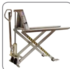
Manuell, elektrisch rostfrei und explosionsgeschützt.