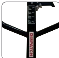
Die Deichsel kann mit Name/Abteilung gekennzeichnet werden.