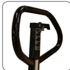
Die ergonomisch geformte Deichsel sorgt für einen entspannten Griff.