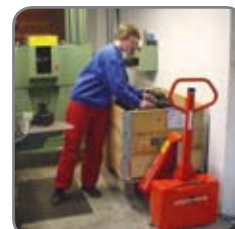
Patentierter Zylinder-Konstruktion ergibt eine niedrige Bauhöhe.

Gerne bieten wir Ihnen auch kundenspezifische Lösungen an. Besuchen Sie auch www.logitrans.com